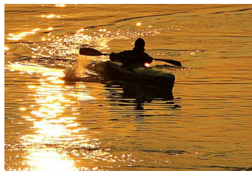
Roberto Faleni "La collina, la pianura, il fiume"